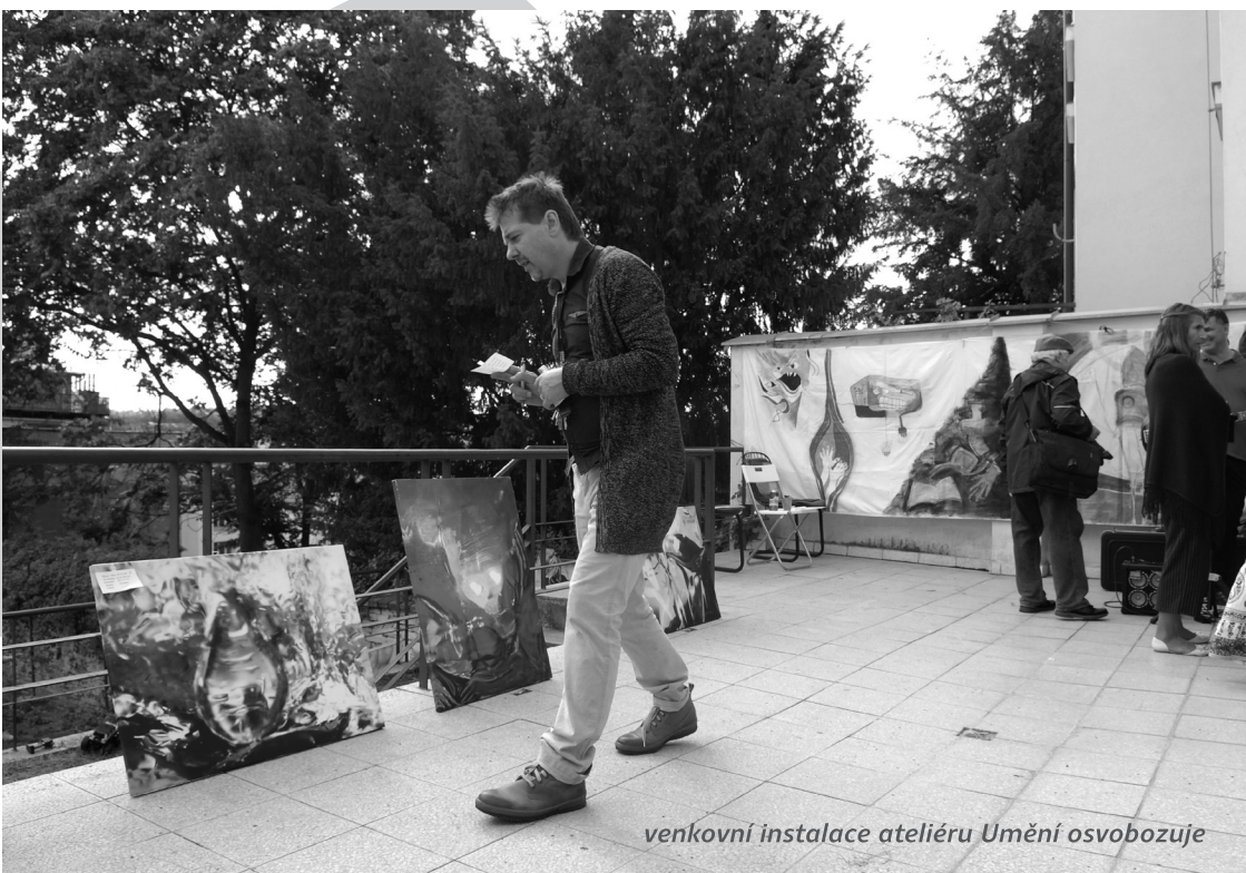
venkovní instalace ateliéru Umění osvobozuje