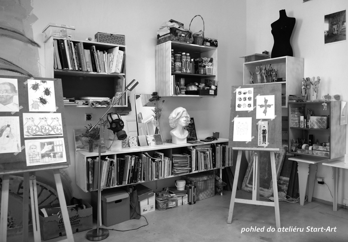
pohled do ateliéru Start-Art